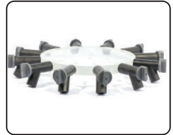
D manifold 12포트