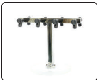
T manifold 8포트