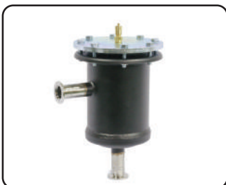
수분 미스트 트랩