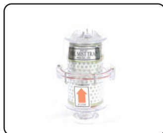
오일 미스트 트랩