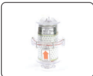
오일 미스트 트랩