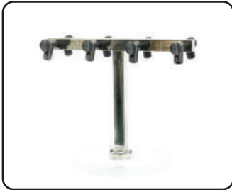
T manifold 8포트