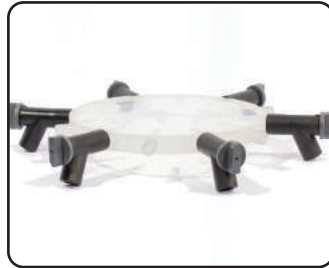
D manifold 6포트