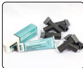
진공밸브 / 진공그리스