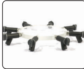
D manifold 8포트