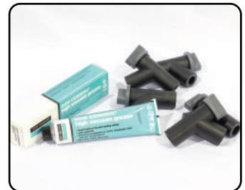
진공밸브 / 진공그리스